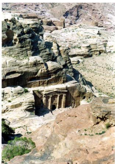
Tumba del Soldado Romano

Por la mañana recorreremos dos inexploradas rutas. Ascenderemos por la ruta del “ Altar de los Sacrificios ” para después descender por la ruta del “ Wadi Farasa ”, que nos permitirá descubrir el Triclinio del Jardín , la Tumba del Soldado Romano , la Tumba Renacentista ... auténticos tesoros nabateos, hasta llegar a Jebel al-Habis donde contemplaremos: el Columbario y la Tumba Inacabada .