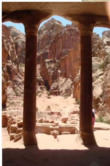
Vista de Wadi Farasa desde la tumba del Triclinio del Jardín