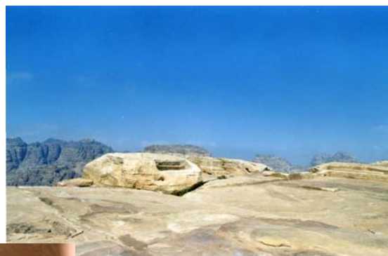
Altar del Sacrificio