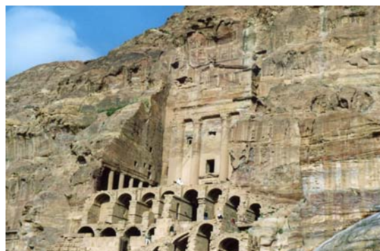
Tumba de la Urna

A última hora de la tarde, concluida la visita, nos dirigiremos por la autovía del Desierto hasta Ammán.