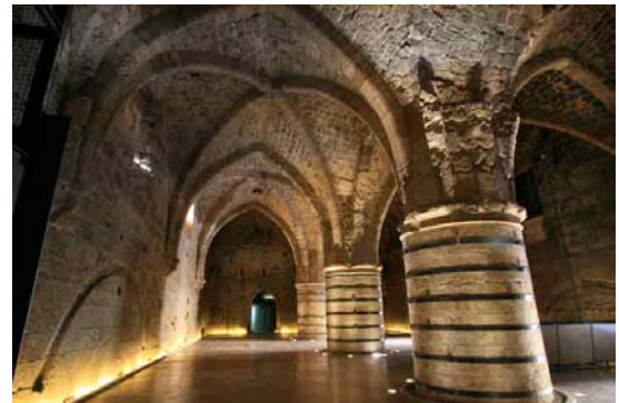
Sala de los Caballeros Ciudad Subterránea de los Cruzados

Proseguiremos hacia las grutas marinas de Rosh Hanikra , ubicadas en un enclave privilegiado, junto a la frontera con Líbano. Descendiendo en teleférico llegaremos a las impresionantes grutas creadas por la erosión marina.