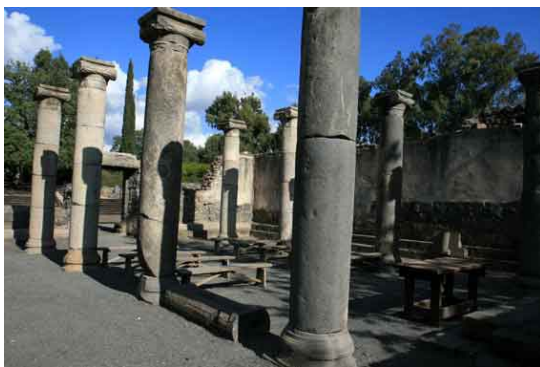
Sinagoga (siglo III) Antigua Katzrin

Subiremos por las colinas del Golán en dirección a Katzrin , conocida como la capital del Golán, donde visitaremos el Museo Arqueológico del Golán , que ilustra la historia de los asentamientos humanos de esta región desde la Prehistoria hasta la época bizantina.