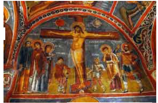
Iglesia de la Manzana

Pasaremos por la Fortaleza de Uçhisar , una enorme roca de 60 m de altura que domina el pueblo, auténtica fortaleza natural que antaño albergó a toda la población, y por el valle de Avcilar en donde disfrutaremos de un increíble paisaje lunar, las llamadas " Chimeneas de las Hadas ", nombre que recibe una de las formaciones geológicas características de Capadocia. Son impresionantes formaciones de aspecto cónico coronadas por un pintoresco "sombrero", algunas alcanzan los 40 m de altura, formadas hace millones de años por la erosión.