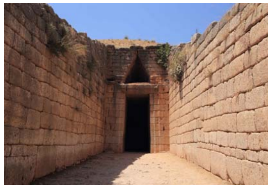
Tumba de Agamenón. Micenas

Por la tarde salida hacia Olimpia . Atravesando la Arcadia, pintoresca provincia del Peloponeso central, llegaremos a la cuna de los Juegos Olímpicos.